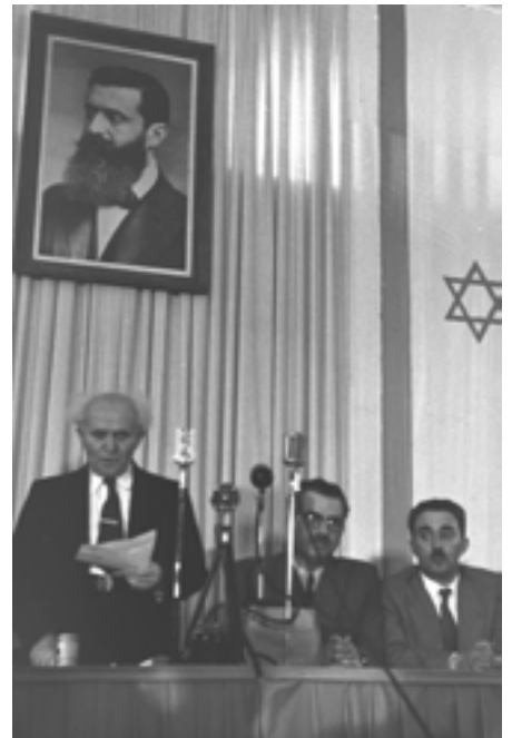
דוד בן גוריון מכריז על הקמת המדינה

● מיקוד על היבטים רוחניים וערכים של המפעל בימינו.