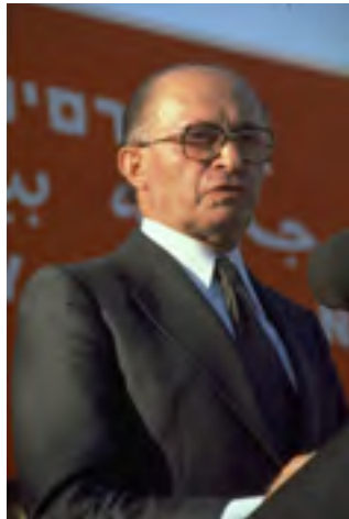
מנחם בגין

במסגרת פגישה עם תלמיד מחזור א' שר שיון שלום, למדנו שבמחזור הראשון של המב"ל בשנת 1963, הקדישו 50 שעות ללימוד על הציונות והשואה.